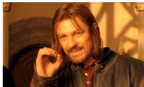
Да-да, тот самый!

А дальше всё заверте... Шон начал не только выступать в театре, но и на телевидении. Он сыграл в целой куче сериалов, но самой примечательной ролью был стрелок Ричард Шарп из сериала «Приключения Шарпа». В 1997 году даже исполнил роль Вронского в экранизации « Анны Карениной ». В 1999 году получает роль Боромира , что приносит ему популярность уже не только в Британии и Америке , но и во всём мире. Алсо, именно в это время зарождается его меметичность и пафосность .