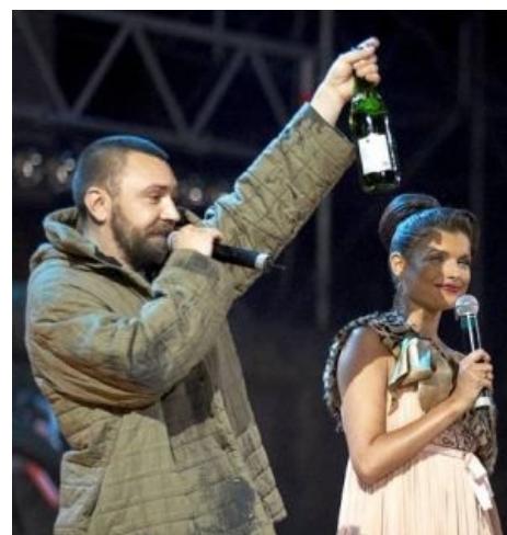
Шнур не пьёт.