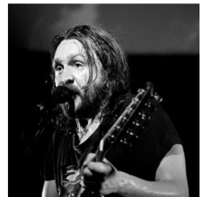
Исполнение песни «Моя Оборона».