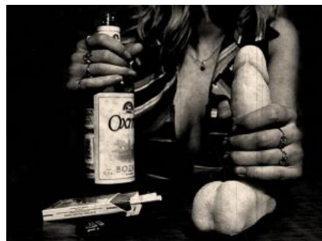
Она в борьбе с комплексами.

Негодование нет предела , просыпающуюся изредка у самца потребность в ебле — отклоняют из мстительных соображений, привычные «у меня болит голова» и «я себя сегодня плохо чувствую» сменяются бешеными истериками, и выяснениями отношений в постели. Находясь в этом депрессняке , они ломаются во всякие быдлоглазники , где и находят там замену своему самцу для ебли, в первую очередь из числа своих знакомых по школе, институту, работе, а иногда и мужей своих подруг. А как же «я не шлюха!»? — а в состоянии бешенства матки этот комплекс серьёзно атрофирован в ожидании романтики и качественной ебли с вероятностью заполучить наконец-то вагинальный оргазм от нового самца, ибо со своим кённем самцом его получить нереально, она уже много раз это пробовала. Став истинной шлюхой и перепробовав всех изловленных по списку самцов, она либо вскоре успокаивается, либо входит во вкус, начинает ценить заботу своего самца, возобновляет практику ему давать и показывает в постели новые навыки ебли, обретенные ею на стороне. Одним словом, начинает демонстрировать немотивированную снисходительность и дружелюбие к некогда ненавистному мужу, что в итоге создаёт в её пизде гнезде эмоциональный мир да благодать.