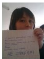
И какает исключительно бабочками