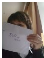
Первый камхоринг — такой первый