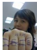
Зато поддерживаем ББПЕ