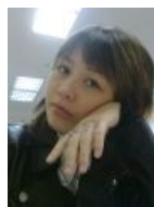
Не учим уроки