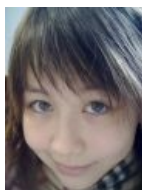
Для «Хороших новостей»