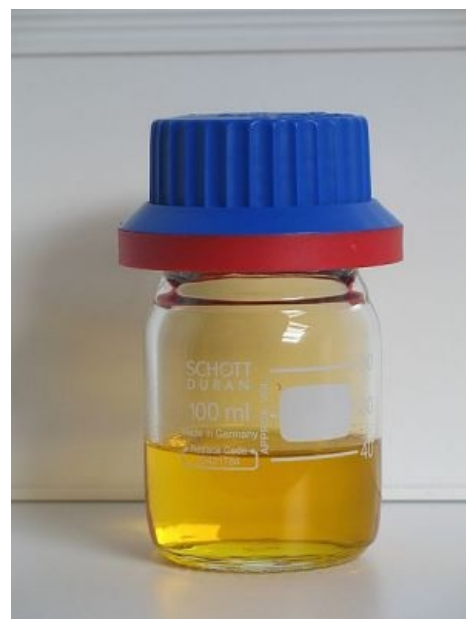
Баночка, наполненная азотной кислотой чуть менее, чем наполовину