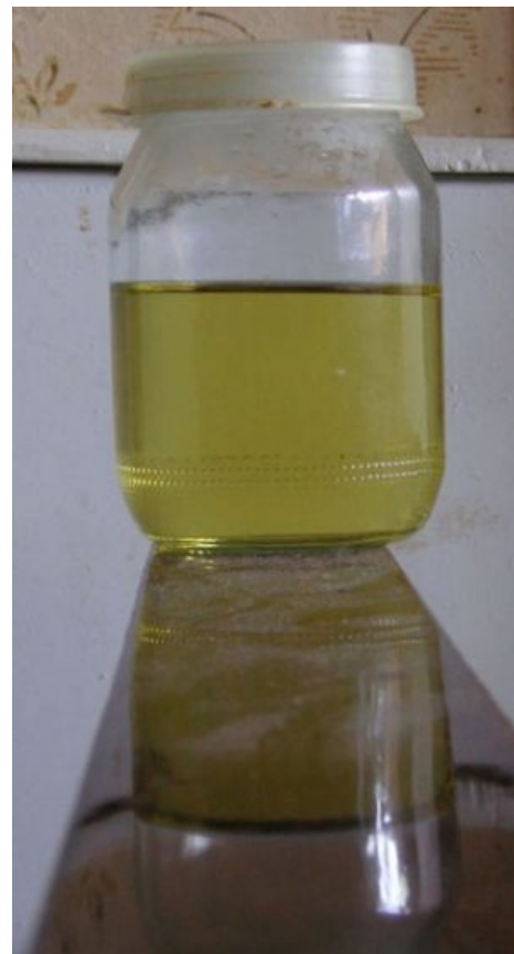
Майонезная баночка с мочою Мицголовой , эталон удельного наполнения «чуть более, чем наполовину». Хранится в поликлинике № 1 Геленджика в Палате мер, весов и анализов

— Вот так. Понятно? — сказал он. С минуту экипаж обалдело смотрел на командира. Молчание прервал Домешек. — Понятно, товарищ гвардии младший лейтенант. Даже больше чем наполовину.