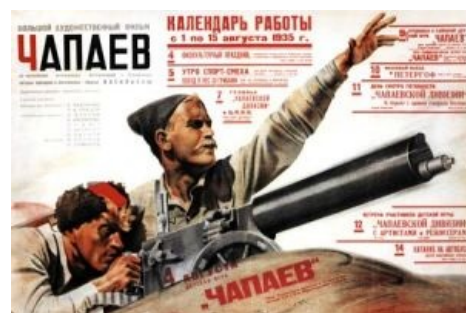
— Петька, нахуй — это воон туда!