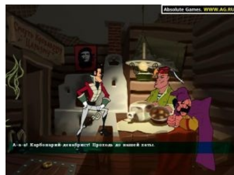
Ржевский, Петька и Чапай

Петька и Василий Иванович. Квест. Любимая игра юности, помните? Тем, кому повезло играть в порипанную версию без заставки, реально повезло.