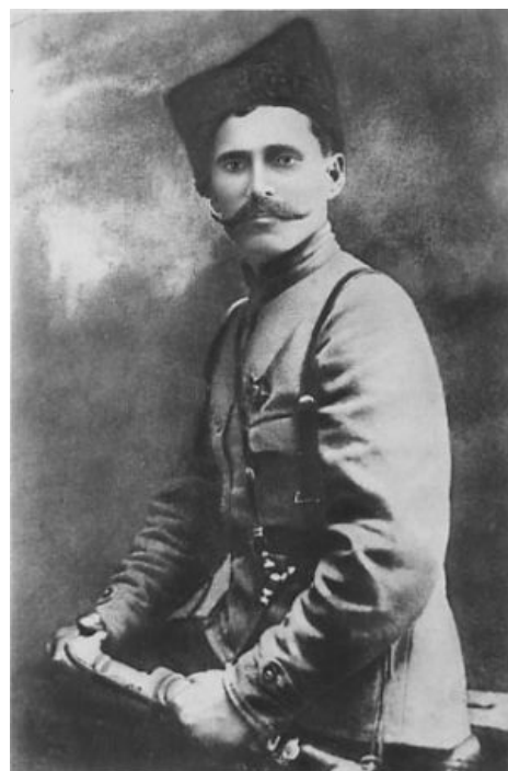
С шашкой, возможно, той самой

Алсо, после фильма получил широкое распространение мем «Психическая атака» , в фильме — атака белогвардейских офицеров в парадном обмундировании строевым шагом на пулеметные амбразуры. На самом деле данная сцена — исключительно плод режиссерского ФГМ, в реале желающих бодро шагать навстречу пулеметным амбразурам находится немного, (хотя Михалков это опроверг снова). Историки , тем не менее, утверждают, что атака была. Конечно же, без парадной формы. Вот только в отличие от событий в фильме, Чапаев этот бой проиграл. Причина банальна — патронов у белых не было, так что единственный оставшийся вариант —