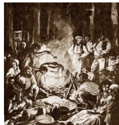
Так цыган видели французы

Самоназвание цыган из Восточной Европы «ром» (в единственном числе) ранее обозначало именно цыгана-мужчину (цыганка — «ромна»), однако сейчас «ром» обозначает и женщину тоже. Наиболее вероятным объяснением этнонима «ром» выглядит то, что они появились в Европе в качестве христианских беженцев из павшей от турок-османов державы ромеев (ака Византия).