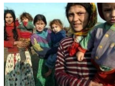
Цыгане внимательно смотрят на дорогой фотоаппарат

«Цыгане известны своим умением вести переговоры, наверно поэтому они так и говорят, чтобы никто ничего не понял. »