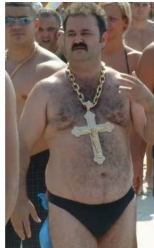
Ром баро сан баро

Многие просветленцы и прочие духовноразвитые девы обоих полов частенько задаются вопросом –как не в пустынях Африки, не в азиатской тундре и даже не в горах Афганистана, а в Индии, подарившей миру ебически сложную философию, математику, шахматы, и как минимум одну мировую религию могло зародиться... такое интересное явление, сочетающееся с вышесказанным ровным счетом никак. Начать придется издалека. В плодородной солнечной Индии, где много-много диких обезьян проблем с народонаселением не было никогда. Первые люди заселили ее равнины еще в те ветхозаветные времена, когда первые хомо сапиенсы выступили из Африки. Именно их потомки, а так же потомки более поздних волн переселения с севера и запада составили костяк коренного, автохтонного населения Индостана. Их потомки до сих пор живут там, получив от индусов прозвище «адиваси». Образ жизни и тогдашних и теперешних адивасей мало чем напоминал полеты в атсрал йогов, браминов и бодхисатв и скорее был похож на образ жизни африканских пигмеев, новогвинейских папуасов или индейцев из глухих джунглей Амазонии. Охотники-собиратели (зачастую, того, что плохо лежит) со строгой патриархальной племенной