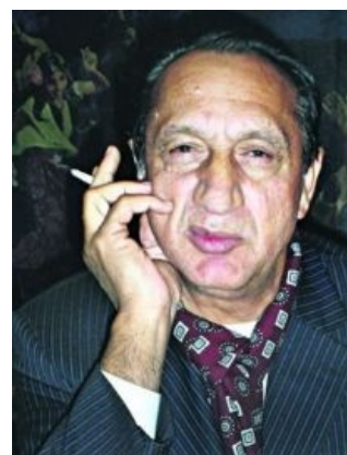
Барон смотрит на тебя как на гаджо