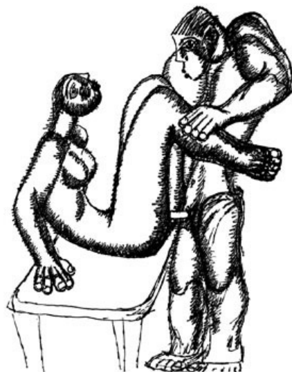
На самом деле это — эротический рисунок маэстро.