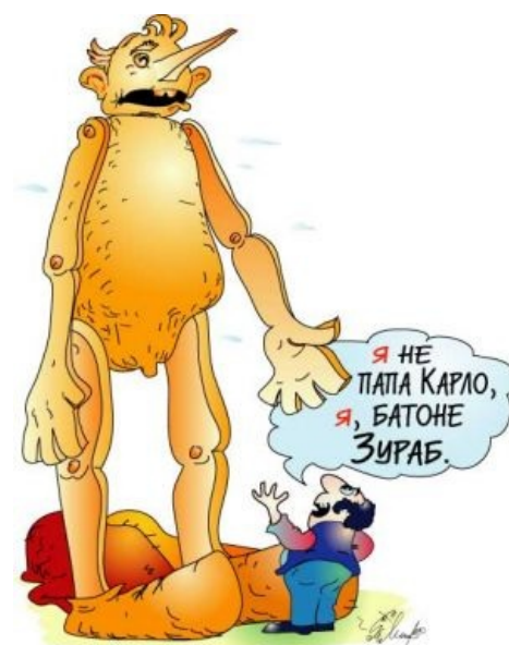
Деревянная работа класса «семь раз отмерь — один раз отрежь»