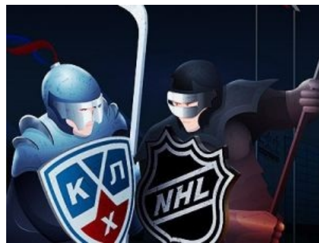
КХЛ vs NHL