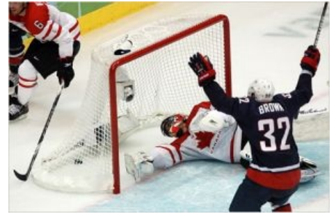
Первая суть хоккея

Поначалу хоккей был весьма суров: защитной экипировки было минимум (вратарь без маски и т. п.), заменять игроков было нельзя (даже травмированных), лёд постоянно таял — всё это приводило к большому количеству травм и не способствовало популяризации данного вида спорта. Позже умные люди правила поменяли, игру распространили, и некий Стэнли основал первый приличный чемпионат с кубком имени себя . Естественно, на чемпионатах мира канадцы доминировали — по той простой причине, что помимо них в хоккей толком играть никто не умел. Хотя и у них были провальные сезоны, что позволило побывать в шкуре чемпионов таким сборным, как США, Чехословакия, Швеция и ВНЕЗАПНО Великобритания. Правда, стоит вспомнить, чьей колонией (а позже полуколонией)