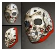
Маска Гари Бромли, just for lulz