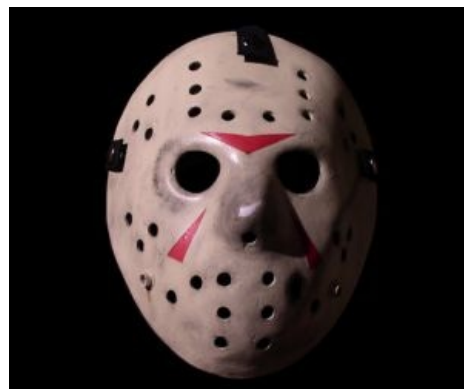
Хоккейная маска конструкции Хиггинса