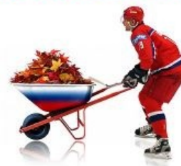
Фан-арт по мотивам победы в 2008 году