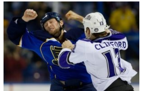
Вторая суть хоккея