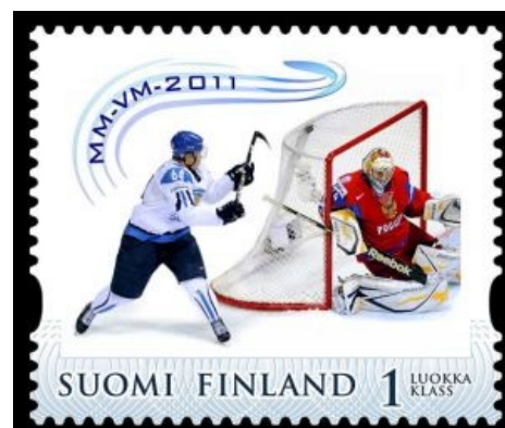
Почтовая марка, посвящённая чудо-голу в ворота Рашки на ЧМ-2011