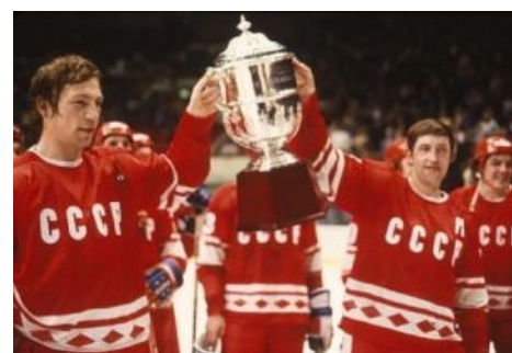
Чемпионаты мира по хоккею 1963 —1990. Конец немного предсказуем

И вот, первый грандиозный фэйл отечественного хоккея на первом же домашнем чемпионате мира в Москве — второе место. И это при том, что Канада и США его отправили в игнор. Затем до 1962 года Канада регулярно давала под зад советским спортсменам, которым надоело из года в год фэйлить, и под предлогом холодной войны они вообще отказались играть в США, принудив к тому же и дружественную Чехословакию. Усиленно потренировавшись на кошках, сборная СССР в 1963 году выиграла-таки третий титул. И пошло-поехало. Внезапно народившаяся советская гегемония заставила канадцев высрать неиллюзорную мегатонну кирпичей, в результате чего на ЧМ стала гонять любительская бобро-сбродная (раньше Канаду представлял клуб, обладатель этого их любительского кубка Аллена). Результат от этого не изменился. Более того, бравых бобров теперь ставили в интересное положение не только Советы и чехи со своими словаками, но и шведы. Этот факт сильно расстроил заокеанских братьев, и они к чемпионату мира как к явлению в мировом хоккее охладели вплоть до того, что самовыпилились из турнира. Главной причиной для этого послужило нежелание Международной педерации хоккея допускать на ЧМ профессионалов из ЭНХаЭль. Так что вся интрига свелась к тому, смогут ли чехи и словаки отомстить Советам за 1968-й год или нет [3] .