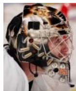
Антеро «Nitty» Нииттимяки