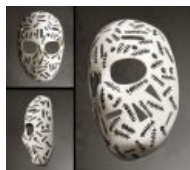
Легендарная маска Джерри Чиверса [5]

Однако же маски не всегда спасают. К примеру, известен случай, когда в НХЛ вратарю Клинту Маларчуку во время неистовой атаки его цитадели кто-то из нападающих какбэ случайно порезал горло коньком, после чего стала шире использоваться защита шеи.