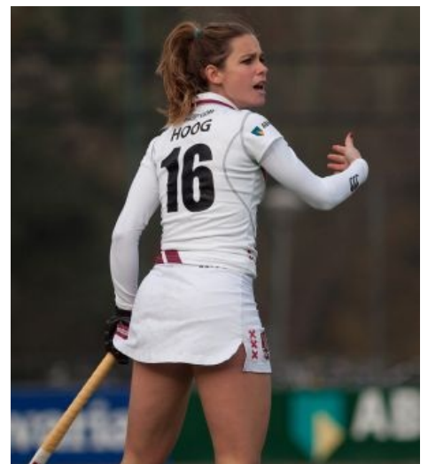
Единственная суть хоккея на