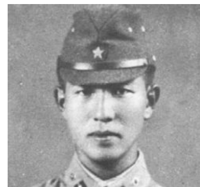
Хироо Онода смотрит на тебя, как на филиппинца

Хироо Онода (мооп. — также Хиро Онода ) (родился 19 марта 1922 года — принял синто 16 января 2014 года) — японский партизан-выживальщик , вошедший в историю благодаря тому, что воевал во славу Императора на Филиппинах с пиндосами и местным населением спустя ещё 30 лет после того, как Вторая мировая закончилась, причём полной капитуляцией страны , за которую он воевал.