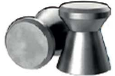
Это — кошерные боеприпасы