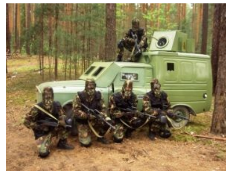
Бойцы на фоне бронемосквича