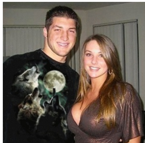
Сабж работает так работает!

Для читателей с гуманитарным складом мышления , кто ещё не понял, стоит ли покупать эту футболку, разрешите объяснить доступно. На большинстве футболок типа этой изображён один волк. А на этой — три, плюс луна. Практически, вы получаете трёх волков с лунной