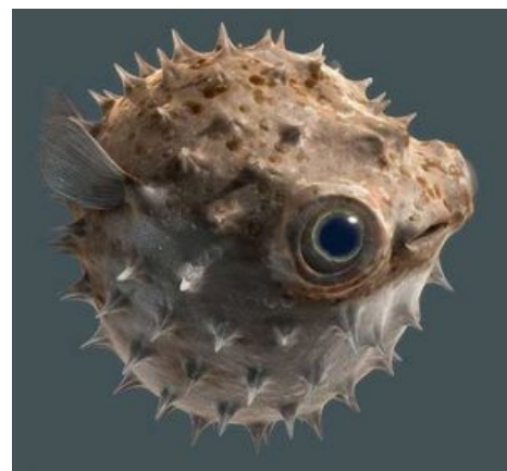
Надутенькая рыбка такая надутенькая.

Большинство умерших от фугу умерли именно потому, что потребовали (за очень отдельные деньги )