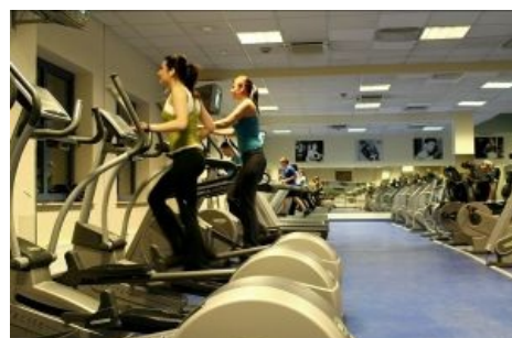
Прототип электростанции будущего, конкурент биореактора