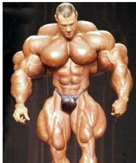
Посетитель фитнес-клуба, как представляет его луркоб

С применением всех доступных маркетинговых приемов — клубных карт, скидок, акций типа «приведите друга в наше анальное