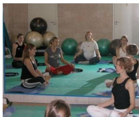
Накачивание ЧСВ овуляшками.