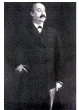
Основателем Бюро Спецагентов был Чарлз Бонапарт — внучатый племянник того самого , который торг.