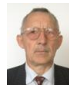
Типичный препод МИФИ

Поскольку они как бэ знают, чему учат, а на деле преподавать можно, зачитывая учебник, работа в вузе полностью отвечает принципу ничегонеделания, к которому они привыкли (см. название — «толстожопые»). Говорить об уровне интеллектуальной развитости этой категории преподав будет излишне — ибо не о чём. Известнейшие примеры: Гайдар (ныне R.I.P.), Лужков (даже не игравший в СимСити).