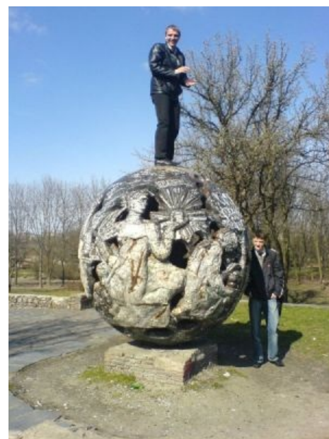
Киевский памятник шару на фоне двух студней (уже снесли)