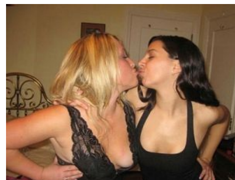
Мы как бы заждались