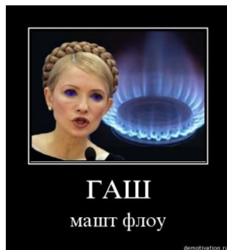
Гаш машт флоу