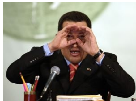
Уго Чавес какбе следит

Уго Чавес (исп. Hugo Chavez , 28 июля 1954 — 5 марта 2013) — венесуэльский теле- и радиоведущий, оратор ртом, по профессии — десантник . Подрабатывал президентом. По национальности — настоящий индеец , по призванию — тролль и доставщик лулзов в мировой политике. Троцкист . Подавился мадой ровно через 60 лет после И. В. Сталина в результате неравной битвы с кубинскими врачами-убийцами с одной стороны и с раком с другой.