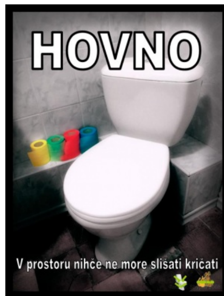
Постер к фильму «Говно» (а слоган из «Чужого»).