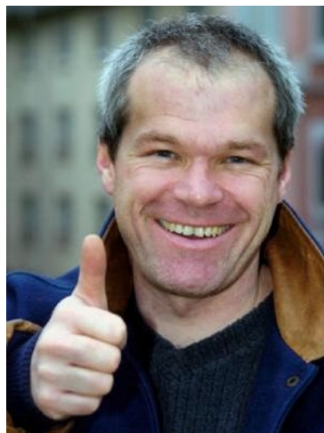
Уве Болл гарантирует.