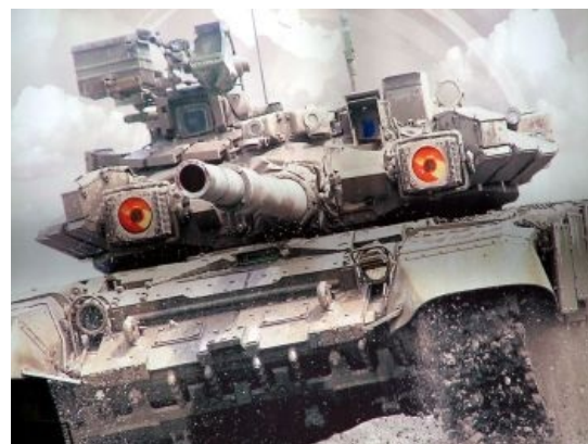
Невыспавшийся Володя по пути на полигон.

T-90 «Владимир» — бывший самый современный танк в войсках этой страны . До недавнего времени — исчезающе малочисленный танк всё той же страны. Сейчас форсится версия T90AM-МС, которые вкупе с T-14 будут представлять танковую тактическую единицу для ведения так называемой сетевцентрической войны . С девяностых годов, существуя в десятках единиц, породил тысячи срачей . А разгадка проста — наличие антагониста в США. Людям после сокрушительного пиздеца перестройки нужно было хоть как-то оправдать фейл — ну не получилось в экономике, зато вот оружие у нас не имеет аналогов . И если самолёт сложен с точки зрения анализа — с дивана ведь не видно авионики и характеристики какие-то непонятные, то танк — как на ладони.