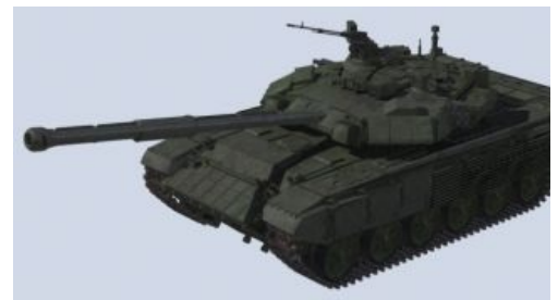
«Объект 187-5» Брутален