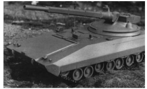
«Объект 299» домчит в далекое будущее

В боевых действиях официально впервые Т-90 приняли участие в Сирии в феврале 2016 года под Алеппо , где, кстати, продемонстрировал вполне сносную живучесть — выдержал попадание в лобовой участок ДЗ башни какого-то варианта ПТУР ТОВ [6] . Для квасно-патриотического сравнения: ближайший конкурент бодро горит от совкового ПТУРа тридцатилетней давности, но в борт. [1]