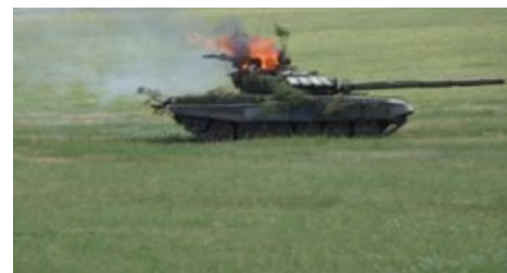
Не выдержал жары

Можно сказать, что все перечисленные недостатки являются нейтральными характеристиками или даже достоинствами по мнению советских и, по инерции, некоторых пост-советских генералов — на большой войне всем похуй на комфорт экипажа, которому жить осталось в самом лучшем случае минут пятнадцать, а отступать русским танкам не положено по уставу, и точка. Но в наше время большая война — детская страшилка.