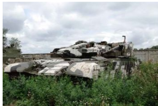
Дети, осторожно, где-то в траве затаилась Гадюка.

Т-90 — хороший, годный современный танк, о чём уже было сказано выше добрую сотню раз, хоть и не лишённый недостатков. Да, в чём-то он может быть и хуже «Леопарда-2» и других западных шутпанцеров, однако российская промышленность может его выпускать, как и запчасти к нему, а отечественные ремонтники знают, как его ремонтировать, что немаловажно. Школота, устраивающая срачи в интернетах, просто забывает, что воюют не миллиметры калибров и не километры в час скорости. Да даже не танки воюют. Воюют люди, и итог боя зависит от огромного множества факторов, в частности, от применения авиации, артиллерии и других родов войск, слаженности их действий и степени головожопости командования. Каким бы ни был крутым танк, вертушка, вооружённая ПТУРами, разьёбёт на металлолом целую колонну таких жестянок, если их не прикрыть от атак с воздуха, что с блеском