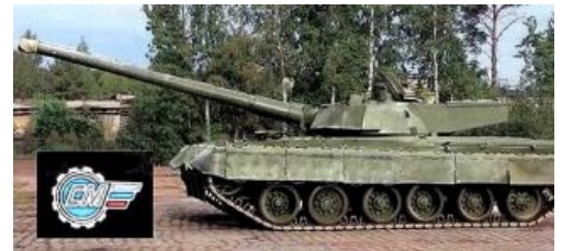
«Объект 292» гарантирует боль