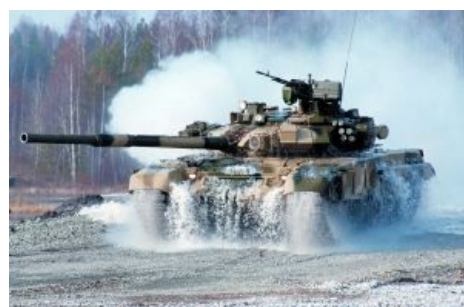
Кагбэ намекает, что и Атлантика — не преграда!