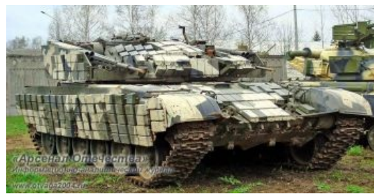
Гадюка, потрепленная временем .