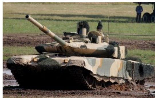
Т-90МС в режиме стелс