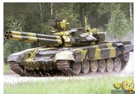
На самом деле вот зачем ему автомат заряжания!