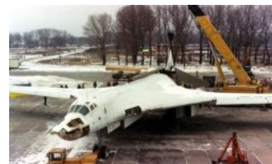
Выпиливание Ту-160 расовыми хохлами.