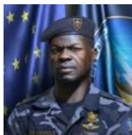
ЧВ на службе Еврофедерации