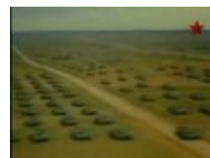
Это могло бы ломануться на Ла-Манш