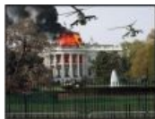
Ми-24 поддают огонька