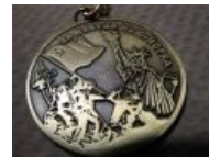
Благоприятное развитие событий