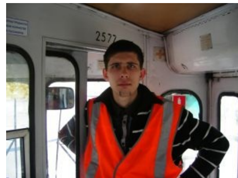
Когда-то — метрофанат, ныне — водила троллейбуса.

Как правило, в комнате транспортного фаната (особенно несовершеннолетнего) очень многое говорит о его сущности. Это может быть, например, взятый в любимом автобусе трафарет ; питерасты неадекватно называют его «аншлагом», недвусмысленно намекая на театральную субкультуру, во многом привнесённую в транспортный фанатизм под влиянием этих . Пространство комнаты заполняют всевозможные коммунальные артефакты (билеты, компостеры, остановочные таблички, наклейки, метла из любимого троллейбуса, куски проводов и прочие нужные вещи). Однако, иногда наступают судные дни, и родители юного коллекционера выкидывают весь этот хлам на помойку. Некоторые фанаты периодически часть своего барахла продают таким же страждущим. Удивительно, но профит получается неиллюзорный (например, цена таблички завода-изготовителя может достигать нескольких десятков убитых енотов ). Что прискорбно в возрастном фанатизме, так это внезапное остывание к увлечению или вышеописанный набег родителей на стратегические склады спизженного добра, вследствие чего заводские таблички глупо теряются и оказываются на помойке, ибо с точки зрения цивилизованных любителей, в том числе в других странах, заводская табличка — это почти единственное, что имеет хоть какое-то оправдание храниться дома, как память о существовавших машинах и символическая дань увлечению.