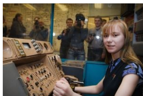
Очень редко среди ТФ появляются