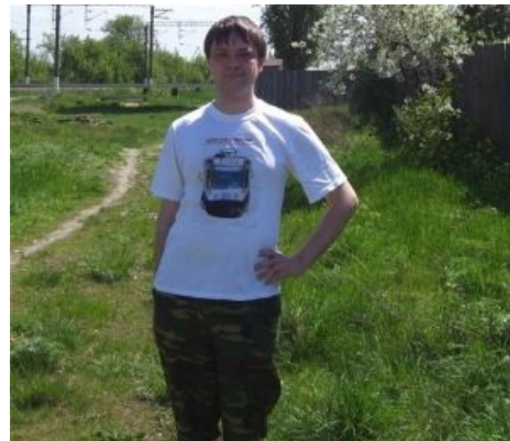
Фанат в трамвайной футболке, теперь фотодрочество возможно на него самого