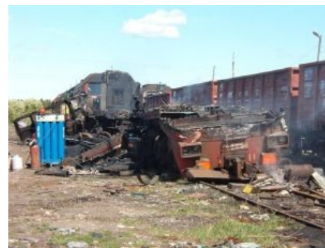
Фанаты срут кирпичами

рассмотреть эти самые маршруты и немедленно их пустить, а также требовать восстановить все снятые трамвайные линии и построить новые, часто длиной в десятки километров и идущие через весь город; или не списывать их любимый вагон метро ;