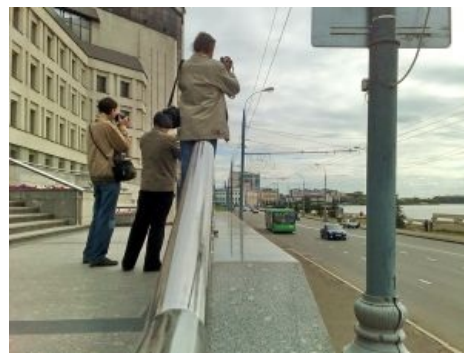
Фанаты фоткают «Мегаполис»

Однако, есть и обратные случаи фотодрочества. На некоторых сайтах юные фанаты борются друг с другом на «фотоконкурсах», ради победы в которых готовы встать в четыре утра, чтобы пойти и снять первый трамвай на фоне чего-то типа красивого, например, восхода солнца. Или же потратить целый день в поисках всякой живности (например, улиток), которые ползают по трамвайным путям. Некоторые особо одарённые