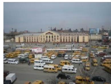
Рай для маршруткофаната: Нижний Тагил , привокзальная площадь. Пруф

Их фанатизм заключается в том, что они собирают информацию о маршрутах маршруток и переписывают в блокнотик номера газелей, которые по ним ездят. Занятие, надо сказать, не такое уж интересное, ибо инвентаризации маршрутки поддаются с трудом ввиду отсутствия бортовых номеров, принадлежности к куче разных перевозчиков и просто большого количества. На форумах маршруткофанаты иногда осторожно пытаются защитить любимый транспорт, что сразу приводит к затяжным срачам с остальными транспортниками о надобности и вреде этих маловместительных развалюх.