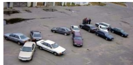
Автоуроды встали на рельсы и мешают трамваям проехать

общественному транспорту. Для этого они ставят свои корыта под троллейбусными проводами, на трамвайных путях, врезаются друг в друга на тех же путях, не давая бедным трамвайчикам проехать. Никто, разумеется, не будет этого отрицать — всё так и есть, мудаков с рулём дофига и больше, но лишь транспортный фанат будет при виде попавшей в сраную мелкую аварию машины или маршрутки исходить говнами так, как будто её хозяин лично повинен во всех бедах его любимого вида транспорта или ещё что-нибудь нехорошее сделал. В случае ДТП на путях/перекрёстках вообще проблема скорее в системе регистрации ДТП и жадности страховых компаний, которые цепляются за любую возможность не выплачивать страховку. Как результат - участники ДТП вынуждены часами стоять в той же позе, в которой были на момент столкновения, пока не приедет ГИБДД и всё должным образом не оформит (а у тех число экипажей тоже не резиновое). От этого страдают и сами автомобилисты, ибо, во-первых, участники ДТП куда-то ехали и планов задержаться на пару часов у них не было (если ДТП легкое, без пострадавших и серьезных повреждений), во-вторых, за ними образуется километровая пробка далеко не только из трамваев, но и из шинного транспорта, которому приходится объезжать их по оставшейся полосе.