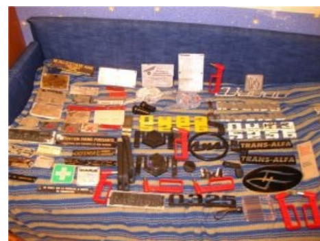
Собрание честно спизженного барахла, повод для гордости одного из фанатов 5-го парка

Применительно к трамваям оба понятия практически не используются, хотя и там любят иногда сэкономить, ставя на на КТМ-8 лобовое стекло от КТМ-5 или на Татру-Т6 боковые окна от Татры-Т3 (особо впечатляюще выглядит, когда они между собой чередуются — добро пожаловать в Тверь). Но, зачастую окна (особенно, дверные) и вовсе заваривают железом, что характерно для многих мухосранских ТТУ, а недавно даже для Нижнего Новгорода.