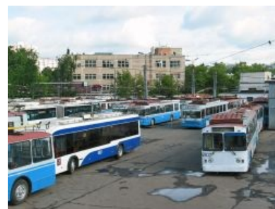
Троллейбусный рай, куда фанатов, к сожалению, не пускают