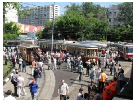
Крупные транспортные мероприятия собирают толпы фанатов