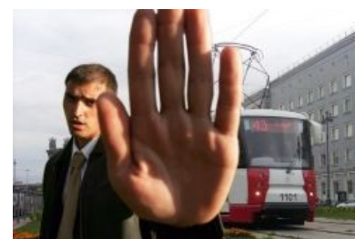
Фанату не дают снять секретный трамвай Путина! (фотошоп)

При съёмке транспорта на общедоступной территории вероятность занять серьёзные проблемы практически отсутствует, если делать это не