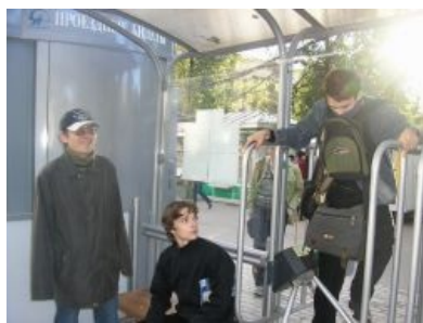
Транспортный цирк на выезде

В середине 2000-х годов во все трамваи, автобусы и троллейбусы Москвы была установлена автоматическая система оплаты проезда АСКП, представляющая из себя установленный в салоне возле передней двери турникет и валидатор — штука для засовывания или прикладывания билетов. Соответственно, вход разрешался только в переднюю дверь, остальные двери были только для выхода (что особенно доставляло в автобусах-гармошках).