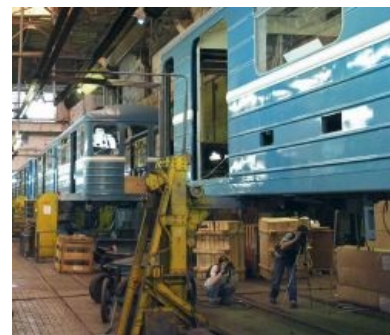
Метрофанаты делают репортаж