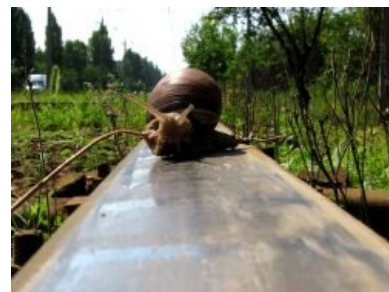
Фотовысер фотоконкурсодрочера- живоде́ра

Практически все из них живьём видели, дай Б-г , только троллейбусы восьмидесятых, если вообще не девяностых годов. В более старых типах (всё, что раньше ЗиУ-9) они ориентируются лишь по рассказам взрослых фанатов (да-да, иногда есть и такие!) и по фотографиям времён совка . Также для этой цели изредка созерцается всякий музейный хлам. Почти всегда — либо сгнивший до того, что в металлолом его не возьмут даже за деньги, либо восстановленный, но с использованием того, что под рукой