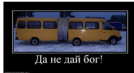
Самый кошмарный сон транспортного фаната

По мнению большинства ТФ, вообще не транспорт, а джихад-арба. Тфу-транспортники не ездят на них из принципа — потому что на них не действуют проездные, они постоянно бьются, и вообще, «паразитируют на системе общественного транспорта» (которой уже давно нет и в помине). Детально же описать процесс паразитизма маршрутного такси на трамвае или троллейбусе, однако, может мало кто [2] . Тем не менее, когда в городе Москве