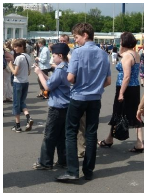
Самые что ни на есть настоящие работники метро