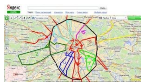
Нарисованный в Paint 'е проект никому не нужных ночных автобусов через всю Москву и во всякие ебеня