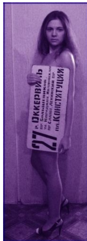
Редкий случай: Ж милая фанатка , любящая ретро