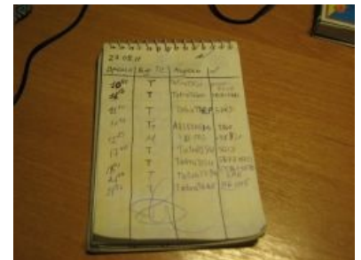
Блокнот транспортной фанатки (Nevidimka), с автографом музыканта любимой группы