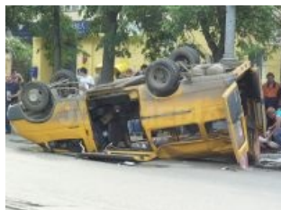
Типичная маршрутка после типичной аварии