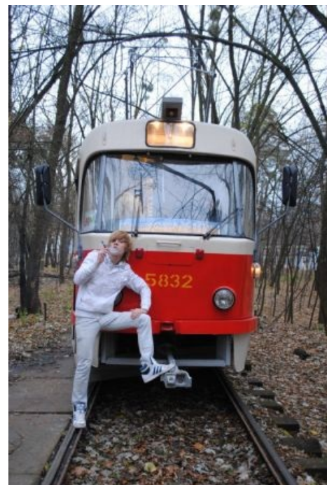
«Не правда ли, мы оба великолепны?»

только в номерах автобусов и целыми днями бесцельно на них кататься, а также фотографировать всё подряд, никак не заботясь о качестве. Является большинством, той самой серой массой, не совсем нормальное поведение которой и явилось поводом для написания этой статьи.