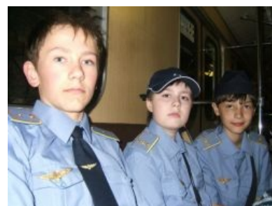
Личинки машинистов метро после тяжёлого трудового дня