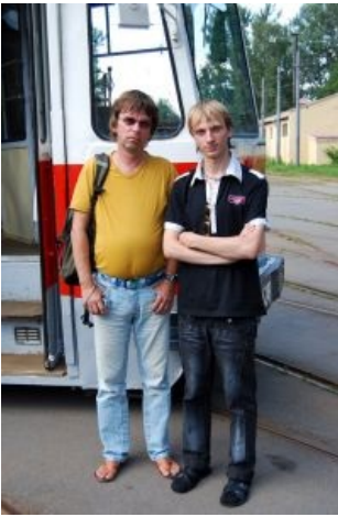
Транспортные фанаты — красивые!