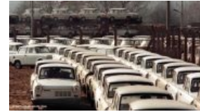
Трабанты готовятся к нобиганию