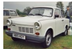
Вот таким он предстал ничего не подозревающему немецкому обывателю