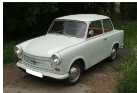
Трабант — это когда с первого взгляда всё известно.