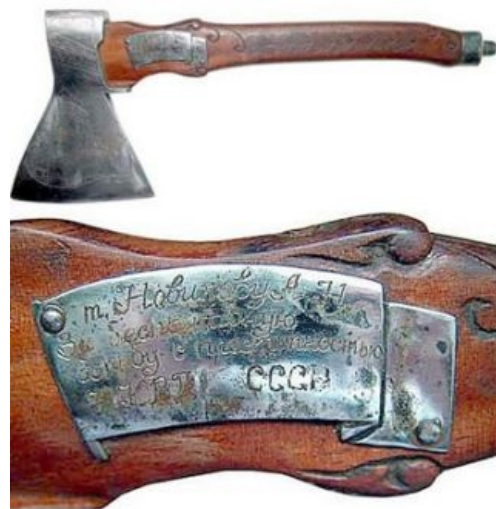
Наградной топор. Сделан для лулзов, а некоторые ведутся.