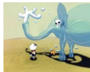
Психоделические красоты Nekojiru-so.