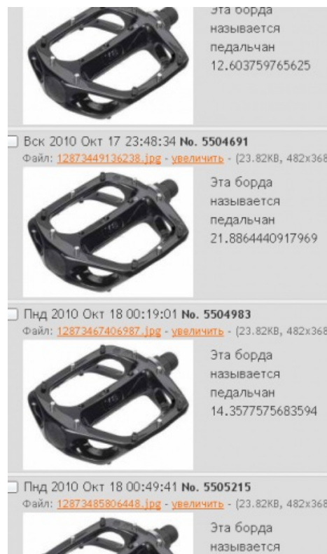
Пример корово-педального баттхерта в /b/ Нульчана