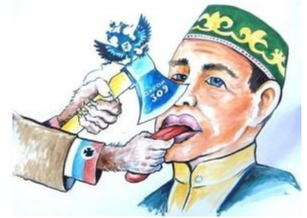
Лингвоцид по версии миллятчистов