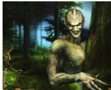
Шурале — былинный татарский тролль