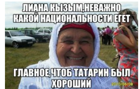
Лояльная татарская бабушка (спойлер: кызым — доченька, егет — парень)

«Даже в сообществе tatar_tele общение в основном не «на», а «о» татарском языке. »