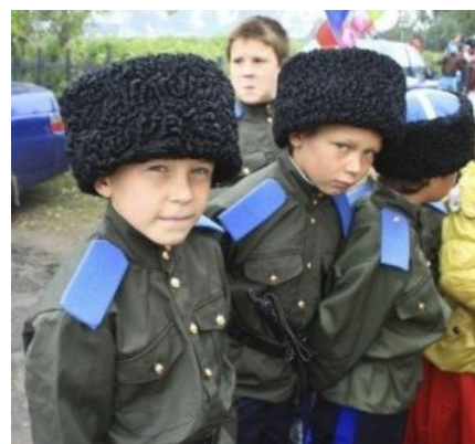
Это не личинки кубаноидов — это суровые нагайбаки

арабской вязью на белорусском! Доставляющий польский писатель Генрик Сенкевич являлся потомком этих татар. Не менее доставляющий голливудский актер Чарльз Бронсон — тоже. В интернетах не встречаются.