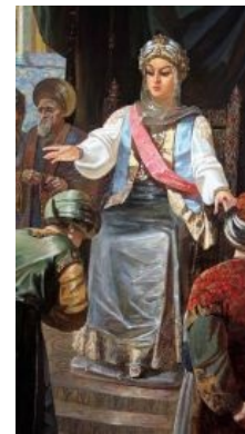
Казанская царица Сюембике