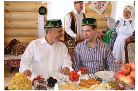
Ну, накатим? По-нашему — по-татарски...