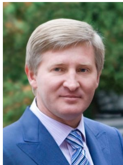
Ринат Ахметов — самый известный мишарский олигарх