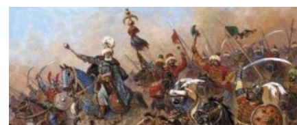
Его трудовые будни