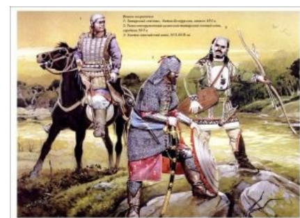
Татарские боевые юнты

После того, как в Орде с дружеским визитом побывал сначала Тамерлан, а потом и чума , татарам стало в падлу жить в едином государстве и они, объявив «парад суверенитетов», запилили средневековый вариант ЕС, со своими персональными ханами в каждой республике.