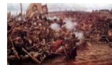
Казачи Ермака набигают