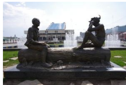
Памятник татаросрачу в Казани. Начало беседы