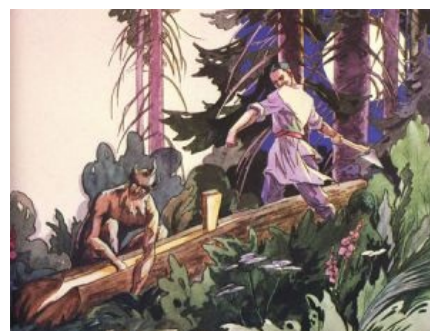
Финал. Татарский модератор карает по-татарски сурово

«Времена ВОВ, немцы строят пленных. Старший подзывает по одному и спрашивает национальность. «Еврей», отвечает первый. «Расстрелять!» говорит немец. «Русский», говорит второй. Немец: «Пока в концлагерь». «Татарин», назвал третий. «Кто такой татарин,- думает немец, — В лагерь, а там разберёмся». «Башкир», четвёртый. «Вот блин тут полно всяких-то! Этого расстрелять!». Тут возвращается предыдущий и говорит: «Начальник, этого со мной, в лагерь! Башкир — это дикий татарин!» »