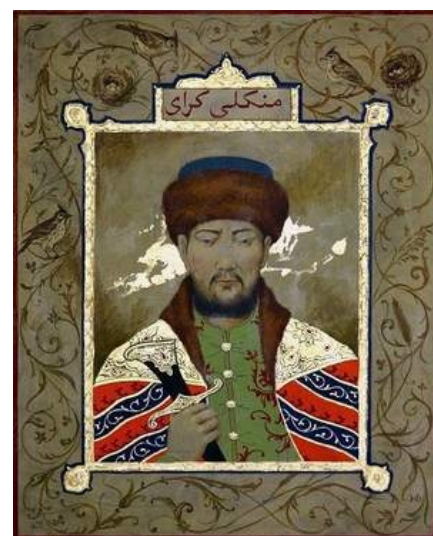
Хан Менгли-Гирей. Фото с доски почета