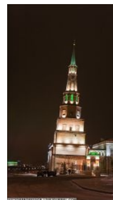
Её башня. Местный аналог Пизанской