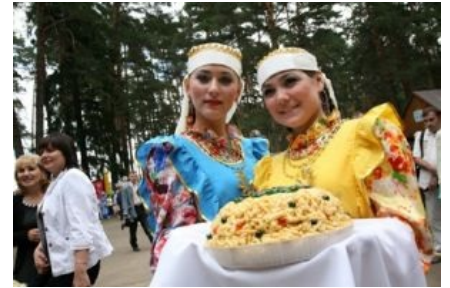
Расовые татарки рады тебя видеть