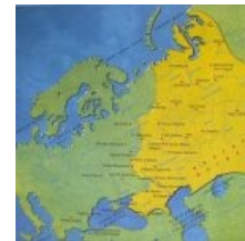
Булгария в большом мозгу булгаристов

Адепты этой теории — булгаристы, люто бешено уважаются «чингизистами», и чувашами. Вообще «булгаро-монгольство» один из самых эпичных внутритатарских срачей, вылившийся из интернетов, и послуживший поводом к «войне историков» в Татарской АН .