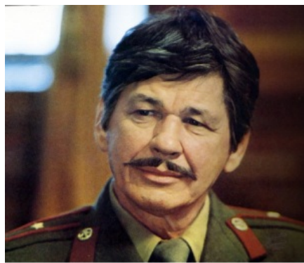
В этой форме сразу видно, что он татарин

обычно отпихиваются от узкоглазых родственников. Но некоторые татары делают заявления , от которых ногайцы испытывают жопоболь. Примечательно, что жители Средней Азии, называют татар — «ногай», и тут жопоболь чувствуют уже татары. Алсо, и сами ногаи живущие в Средней Азии нередко самих себя именуют татарами. Те, что живут в Узбекистане, говорят на особом узбекско-ногайском диалекте, заметно отличающегося как от обычного ногайского, так и обычного татарского языков. Алсо, один из диалектов крымско-татарского носит название «ногайский диалект». Надо также заметить, в Европе татары, обязательно включая ногайцев, считаются очень красивыми.