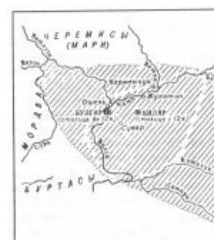
...и Булгария в представлении великорусских историков

Троллить булгаристов несложно. Достаточно спросить, почему единственным живым языком булгарской группы считается чувашский, а не татарский. Чувашский язык татары не понимают, и просьба перевести с чувашского вызывает жуткий батхерт . Кроме того, можно обвинить поциэнтов в раскалывании нации, так как многие татарские этнические группы не имеют к булгарскому государству никакого отношения. За это можно сразу получить клеймо агента кремля, продавшего историю родного народа за банку варенья и пачку печенья. Впрочем, аналогичный диагноз, можно получить и у «чингизистов», если начать защищать булгарскую теорию. Можно также упомянуть о том, что булгары изначально родом из Азии и предъявить антропологические реконструкции их черепов. Тонны кирпичей от евробулгар гарантированы. Вообще булгаристы по поведению очень схожи (в зависимости от степени запущенности заболевания) с долбославами , ПГМ-нутыми или лицвинами-змагарами .