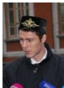
Марат Сафин в национальном головном уборе