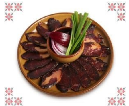
Та самая конина...