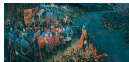
Стояние на Угре