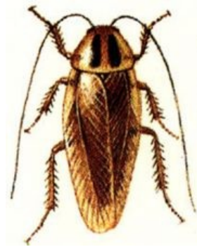
Сферический «прусак» в фотошопе