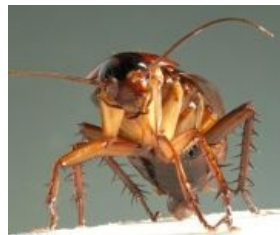
Американский таракан смотрит на тебя своим суровым и пронзительным взглядом как на бесперебойный источник еды.