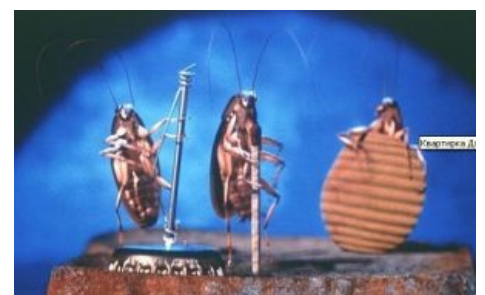
Кадр из этого же фильма