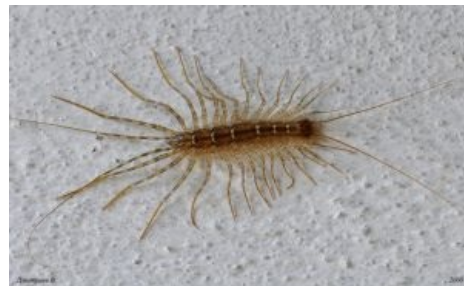
Многоножка-мухоловка — домашний охотник на тараканов. При встрече погладь её и попробуй поцеловать