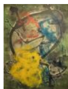
Что-то, где-то, как-то