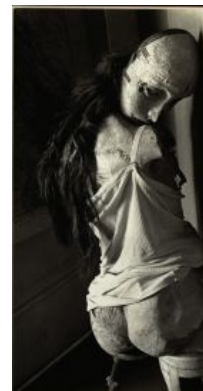
Одна из кукол Балмера