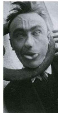
Ив Танги, один из художников

Невозмутимые картины, с невозмутимыми яблоками и котелками на невозмутимых фонах. Ныне святыня и гений вся Бельгии. [2] [3] . Имеется также кошерный музей нестандартного экстерьера.