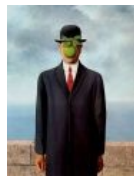
Фирменный стиль Магритта - шляпы, пальто и яблоки