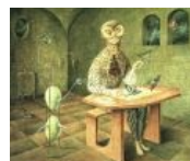
Remedios Varo. «Создание птиц»