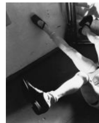
Одна из кукол Балмера