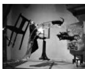
Известное фото Дали руки Филиппа Халсмана