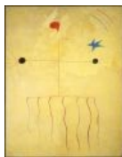
Найди голову каталонского крестьянина

Миро терпеть не мог никакого планирования, хождений на работу вовремя, и вёл себя как типичный представитель художественной тусовки Парижа. И не беда, что жрать нормально можно было лишь раз в неделю, а остальное время давиться только финиками, зато художник считал себя свободным и счастливым. В мастерской было свалено несколько уютненьких мешков, на которых всегда могли проспать его друзья после очередной бурной попойки. Затем всё, конечно, устаканилось, как только сюр стал модным и стильным течением, принеся неплохие дивиденды.