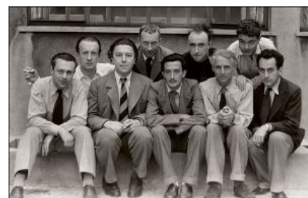
Вот эти ребята во всем и виноваты