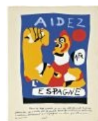
Плакат «Помогите Испании». Должен был мотивировать во время гражданской войны