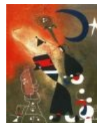
Женщина и птица в лунном свете. Нет, правда!