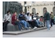
Сбор донатов для Тиреча