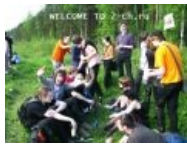
Типичные посетители Тиреча