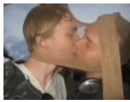
И даже они