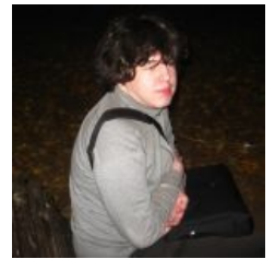
Молчаливый неняшка little aka Pururin