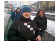
Брони на сходке