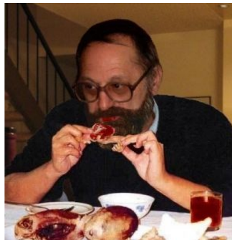
ЕРЖ таки тоже разрывают зубами православных младенцев!

Исходя из вышесказанного, нетрудно догадаться, что глобальное введение этого супца в обыденный рацион человека будущего способно составить немалую конкуренцию биореактору . Больше того, это и намного полезнее — метан как топливо нового поколения представляет довольно спорную пользу, а изготовить сотни энергии прямо из воздуха для человека будущего не составит труда. А вот перенаселение и повсеместное засилье малолетних долбоебов и школия , особенно в этих ваших интернетах, нуждается в тотальном и жестком контроле, во имя великого и светлого будущего человечества. А иначе пиздец ему, Анон! И, если верить китайской народной медицине, получается одна сплошная польза: проблема голода решена — раз; проблема перенаселения решена — два; проблема повсеместного засилья быдла решена — три. От оно как! Хитрожопые китайцы знают выход из любой тупиковой ситуации. Такие дела.