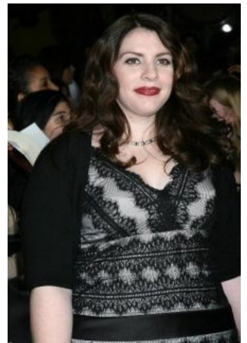
А ведь есть вероятность, что на самом деле она просто жирный тролль