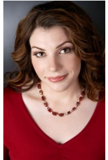
Сон Стефани рождает уёбищ