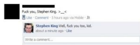
Стивен Кинг и малолетний поклонник Штеффочки

full length twilight trailer reaction!!!! Феерическая расстановка точек над целевой аудиторией