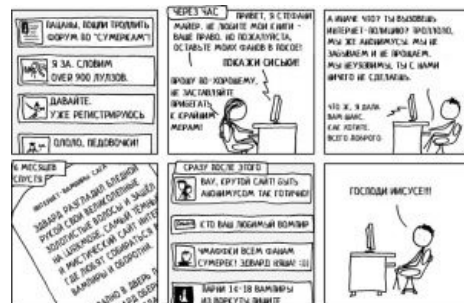
Стефани наносит ответный удар

Спор на тему «Эдвард — вовсе не идеальный парень, а глупый инфантильный мальчишка». Аргументы: