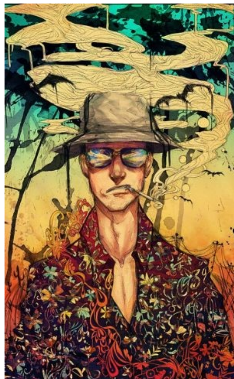
Рауль Дюк, подозрительно похожий на Хантера Томпсона