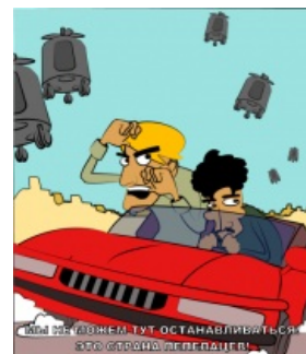
Вариант, не прошедший цензуру