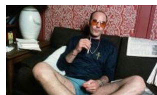
Аффтар под дозой. (да, Он самый)

История фильма началась именно тогда, когда Хантер Томпсон, ставший, кстати, прототипом Спайдера из Transmetropolitan , написал сие произведение в особом стиле — гонзо-журналистика . Этот вид создания репортажей отличается крайней субъективностью, видом на события изнутри, ведением рассказа от первого лица — полным погружением в вопрос, так сказать. Эталоном этого жанра является статья Томпсона « Дерби в Кентукки упадочно и порочно », в которой он в красках описал местное быдло , жлобов и алкашей . Именно в таком ключе и был снят фильм.