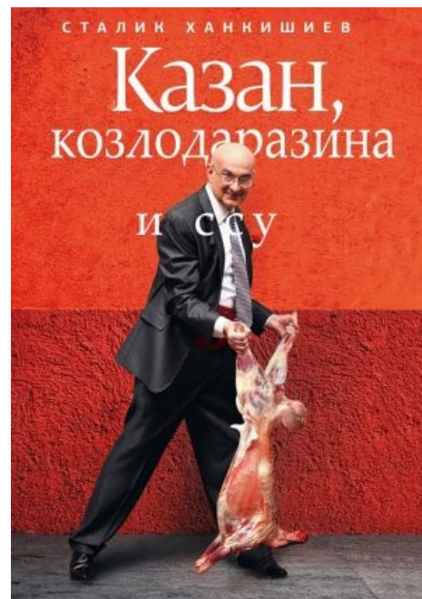
Сталик и его жертва

29 ноября 2015 г. пациент совершил очевидное и невероятное для понимания социума. А именно: умудрился пропиариться на смерти своей собственной матери и устроить очередной мегасрач на её костях. «Как смерть матери превратить в фарс!..» . Не удивительно, что ему сразу же припомнили его