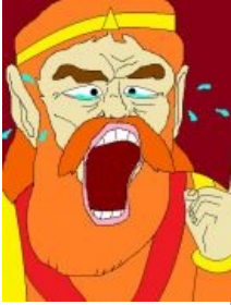
Not at all, mah b