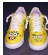
Радость любой педовки