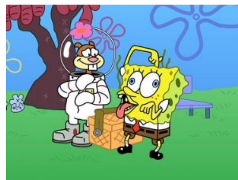
Сэнди и Спанч Боб