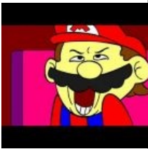
Not at all, Luigi..