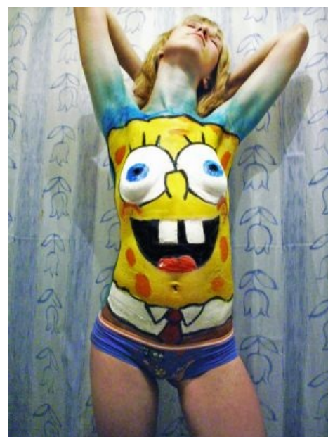
Вот они, косплееры-лесбиянки

Особенностью местной физики является тот факт, что никто не вспоминает, что живёт под водой до тех пор, пока не попадёт на сушу (не может дышать воздухом). Однако же в серии «Pressure» персонажи на спор вышли из воды и неплохо провели там время с местными чайками. И напротив, они не могут сидеть у Сэнди дома без банки с водой на голове. Во всём остальном всё как на суше. Есть даже местный водоём тёмно-синего цвета, т. н. «Грязевая Лагуна». Сценаристы, однако, не прочь иногда постебаться на эту тему, поэтому в некоторых сериях персонажи преспокойно сидят у костра (аккурат до момента, когда вспоминают, что так под водой, таскетта, нельзя), а отправленные с суши письма невозможно прочитать из-за того, что от чернил остаются одни разводы.