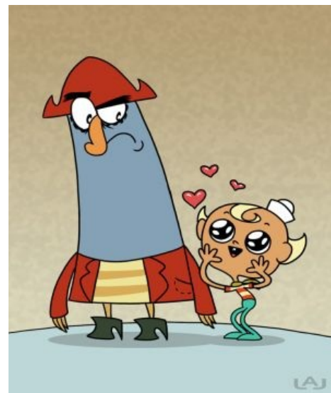
Ага, вот эти ребята

Weege drops by Squidward's house To самое видео WTF Squidward!? Oh, exploitable! What happens when Weege and Malleo visit Squidward Weege и Malleo Mr Bean drops by Squidward's house Мистер Бин The Chocolate Guy visits Squidward's house Chocolate Guy Alicorn Twilight Drops by Squidward's House И снова пони Squidward drops by Squidward's House Рекурсия https://www.youtube.com/watch?v=BbIOfjhURBo «Я Сквидвард, он Сквидвард. Мы оба Сквидварды» https://www.youtube.com/watch?v=0p8F6Kw4gSs Gangnam Style