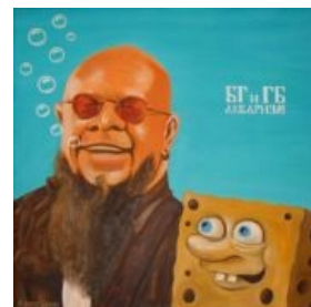
БГ и ГБ

Шелдон Планктон — крайне антагонистичный тип . Постоянно стремится захватить мир . Страдает комплексом Наполеона и завышенным ЧСВ . Владелец отсоснейшей забегаловки « Помойное ведро ». Постоянно холиварит с Крабом из-за секретного рецепта бургера. Имеет жену-компьютер Каррен.