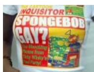
Спанчбоб — гей? WTF?! Скандалы, интриги, расследования