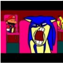
Not at all, Tails..