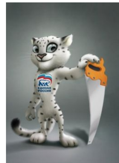
Финалист гонки от Единой России. Как бы намекает... на основательный подход ...

В честь олимпиады Центробанк выпустил памятные деньги: монеты по 25 рублей и, по примеру пекинских игр 2008 года, банкноты по 100. Хрен