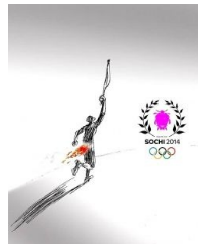
Без огня не останемся

Примечательно, что вопрос компенсации стоимости работ инициатор их проведения, администрация Перми на обсуждение пока не выносит. Ранее пользователи facebook сообщали, что параллельно ООО «Садово-парковое хозяйство» по распоряжению администрации города Перми приступило к обрезанию деревьев(!!!) на улицах, по которым будет пронесен факел Олимпиады. Надо полагать, власти опасаются, что факел может утопиться со стыда в канализации, или повеситься на дереве от радости.