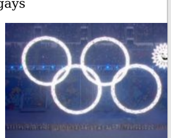
Hot. Cool. Not fully yours