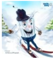
Стакаша — не менее доставляющий альтернативный тру-логотип олимпиады