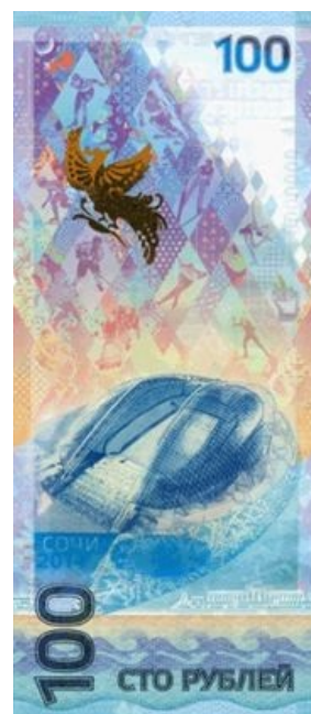
Олимпийская банкнота, оборотная сторона