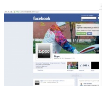
Та самая Зиппа