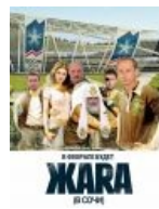
В феврале будет жара