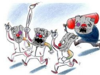
Как это было

Также бытует мнение, что изготовители факелов были предателями