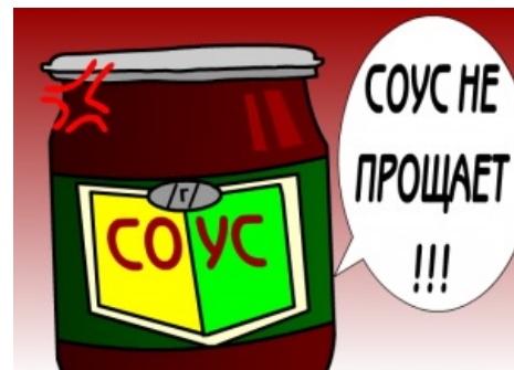
Соус не прощает!