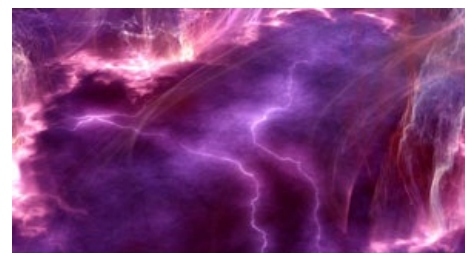
Неведомое космическое нечто