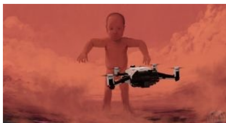
Тот самый ребёнок в представлении художника

Зато Океан, по-видимому, вполне преуспевает в изучении «понаехавших» на планету существ, и прозондировав персонажам мозги, выуживает из них самые сокровенные воспоминания, которые они, очевидно, стараются забыть, с дальнейшей целью преподнести им в материализованной форме — то ли ради лулзов , то ли из-за неистребимой склонности «мыслящего океана» к поиску глубинного смысла . Последовавший за этим триллер лучше прочесть в оригинале, стоит только заметить, что к созданию романа Лем подошел настолько серьёзно, что придумал, а главное, изложил не только сюжетные линии, но и историю открытия самой планеты, её период вращения и расположение относительно звезд и прочей хрени, а также классификацию явлений, демонстрируемых океаном