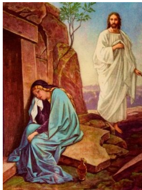
Спящая юная дева

История с Солевой в очередной раз вызвала в прессе волну обсуждений легкодоступных дешёвых наркотиков и повальной деградации молодёжи. Слетевшиеся как мухи на мёд главные кнопки метрового диапазона крепко уцепились за эту тему и долго обсасывали её со всех сторон.