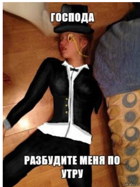
Пикабляди склепали ниграмматную фотожабу

Анонимус, будь осторожней: женщина может встать, отряхнуть юбочку и пойти дальше, а может и засадить тебя на много лет. А секрет её выбора прост — узнает ли её мать о приключениях дочки в активном отдыхе или нет. Алсо, нужно быть редкостным долбоёбом , чтобы собственноручно довести