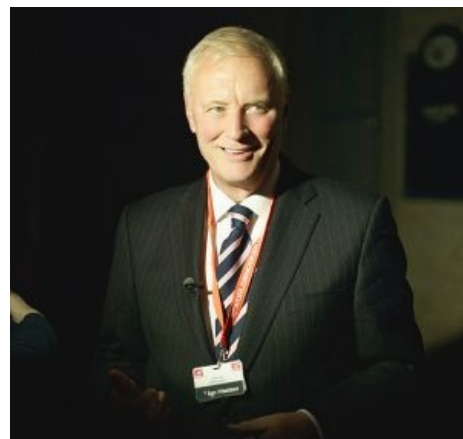
Барри Хирн — своими невьёбенными гонорарами снукеристы обязаны ему

Главными продвигателями и нагибателями стали Барри Хирн и Джейсон Фергюсон, истинные британцы, но по повадкам — чистейшие ЕРЖ. Новые руководители просекли, что профит имеет тот, кто получит место в зомбоящике , и подписали контракт на показ турниров по телеку, выбрав спонсорами несколько табачных компаний. ВНЕЗАПНО игра всем пришлось по нраву. Небыдло фапало на сложность комбинаций, духовно богатые девы шликали на постоянно мелькавшие в кадре задницы снукеристов, обыватели спорили «мой Хендри твоего О’Салливана сегодня порвёт». Дальше снукером увлеклись кетайтсы, которые бабла не жалели, а когда французы запилили канал «Евроспорт», снукерные боссы первыми окучили эту ниву. Когда лягушатники открыли рот на тему того, что родной канал показывает вражескую игру, руководители канала ответили — « норот желает смотреть, как шар влетает в лузу. В карамболе луз нет, влетать нечему, смотреть скучно, а потому звиняйте, может, в другой раз ».