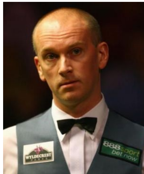
Эбдон понимает, как он всех заебал

Стивен Ли — как и Джимми Уайт, неудачник 80-го уровня , но по несколько иным причинам. Будучи одним из самых талантливых и техничных игроков тура, Ли, тем не менее, не отличался стабильностью, а потому с победами у него было не очень. Тогда Стив решил немножко поиметь систему и подзаработать на договорных матчах. Вот только, как это часто бывает, система в итоге поимела его — да еще и как! Ли отстранили от участия в туре на 12 лет (что даже для молодого снукериста смерти подобно, не говоря уже о сорокалетнем Стивене) и вlepили внушительный штраф, сделав из него пример для остальных игроков. Однако на этом история не закончилась. Вскоре Ли договорился с поклонником о продаже личного кия,