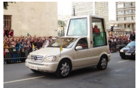
Папамобиль огорчает военнов ислама

По этой же причине снайперская винтовка полюбилась организованной преступности , в результате чего за полвека из нее была отстреляна целая куча бизнесменов, политиков, конкурентов по криминальному ремеслу и даже один президент США (последнему событию посвящена отдельная игра-реконструкция — теперь убить Кеннеди может каждый). Следствие всей этой веселухи — политики и прочие VIP перестали ездить в кабриолетах и пересели на броневики, из которых выходят только окружённые со всех сторон охраной. Впрочем, некоторым и это не помогает, и список принявших ислам регулярно пополняется.