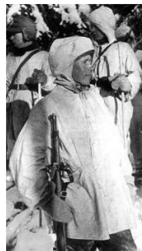
Симо Хяюхя до...

Винтовки для «кривой» стрельбы из окопа. Слева немецкая, справа американец. Точность как вы понимаете была аховой.