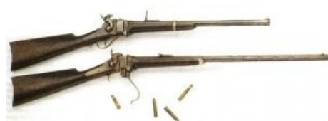
Винтовка Sharps как она есть. Ещё не снайперская, но уже близко.