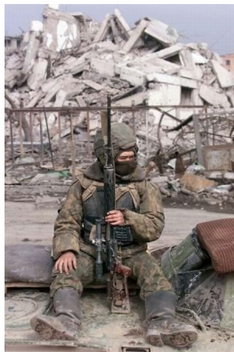
Суровый армейский снайпер заебался бегать по развалинам.