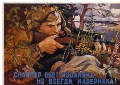
Советский плакат приоткрывает суть

Кентуккскую винтовку сменила винтовка Холла , а затем во время Гражданской войны и другие, более новые вундервафли, уже под унитарный патрон и с первыми оптическими прицелами. Все джентльменские тонкости были окончательно отставлены в сторону демократическими гражданами, в результате снайперы немедленно приобрели репутацию профессиональных убийц и