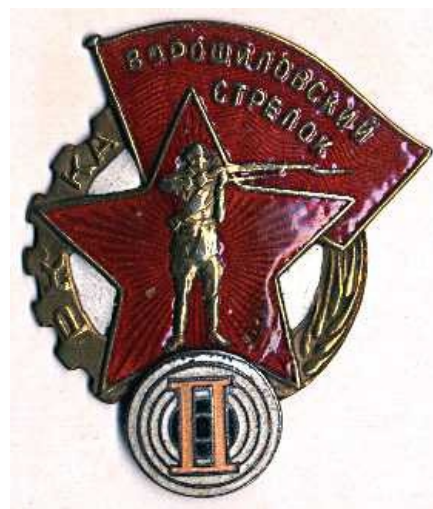
Знак ворошиловского стрелка второй степени. Стремись, задрот!