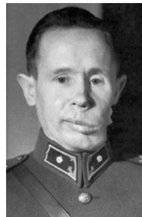
...и после фейс-рестайлинга.