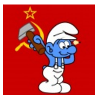
Смурф совковый, обыкновенный.