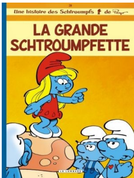
Золотая мечта феминистки

Да, да! Даже в такой няшной и кавальной теме всегда найдется место срачу. Правда, в основном они происходили IRL, поэтому рядовому Анонимусу мало о них известно: