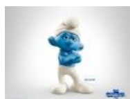
Он смотрит на тебя как на говно Гаргамела.