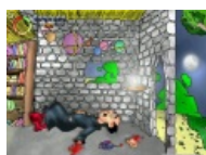
Гойгомель жестоко замучен.