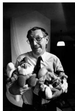
Доброе лицо на фоне любимой кормушки

Кстати, семья Пейо дала полное одобрение на создание этой рекламы.