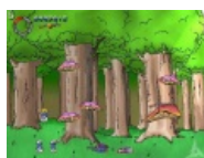
Blip&Blop: balls of steel.