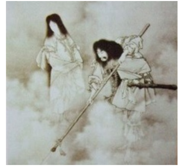
Идзанаги и Идзанами, тоже синтоистские боги

Составить точный пантеон богов синтоизма невозможно в принципе, но главной у них является ВНЕЗАПНО самка , по имени Аматэрасу (moon. ). Именно от неё и происходит род японских Ымператоров. Другие синтоистские боги «основали» японские острова. И вообще отношение к богам ( ками ) у синтоистов весьма своеобразное, ибо, согласно их взглядам, каждый человек после смерти станет ками . Раньше некоторые, в первую очередь