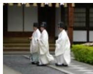
етая Группа каннуси

Синтоистские священники имеют целый ряд уникальных особенностей. Так, для них вполне нормально исповедовать другую религию или не исповедовать никакой, что является абсолютным нонсенсом для любого непосвящённого человека. Мальчики-священнослужители зовутся Каннуси (moop. ), а девочки — Мико (moop. ). На протяжении веков каннуси обычно получали свою должность от покойного батьки, но в наши дни для этого необходимо окончить специальный универ. А в течение последних лет 60-ти, под влиянием всеобъемлющего феминизма , в стройных ряды каннуси стали затёсываться и женщины. Алсо, одежда каннуси не имеет никакого религиозного смысла и чаще всего банально косплеит аристократический прикид XII века. Наконец, догматы синтоизма позволят каннуси ебаться и заводить отпрысков.