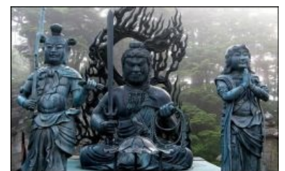
Суровый идол сюэндо

Самый известный широкой публике деятель Сюэндо — Мироку из InuYasha . Этим объясняется, почему он вроде бы монах, а всё равно хочет жениться. Монах-то он только во время обучения, а как закончит и вернёт обеты, то жениться будет уже можно.