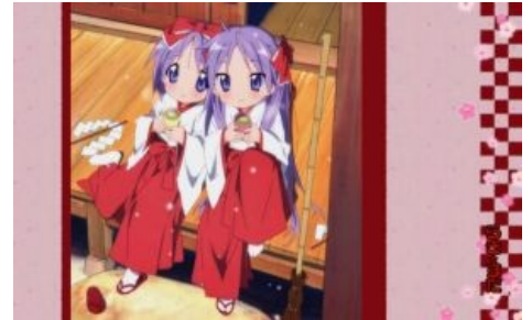
Мико в аниме

Многие анимешники, прочитав всё вышенаписанное, зададутся логичным вопросом: «а почему тема синтоизма так слабо раскрыта в аниме, и одновременно там сравнительно много (для страны с таким низкой долей христознутаго населения) отсылок к христианству?» Причина необычайно проста: вы когда-нибудь видели отечественный фильм, где священник будет бегать с шотганом и мочить чертей ( Охлобыстин не в счёт)? А американский? В глазах любого последователя или потомка последователей одной еврейской секты этот юмор будет неуместен. Даже если и найдутся желающие снять кинцо на указанную тему, ХГМ-нутые патриархальные круги общества аналльно не одобряют сию затею. Для японцев, необычайно уважающих традицию и культ предков, снимать анимешки про синтоизм — значит посягать на нечто сакральное.