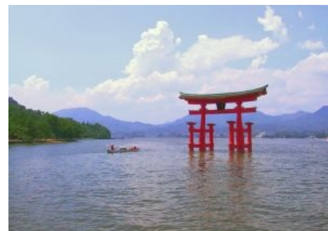
Плавающая тории плавуча

Среди национально озабоченных синтоистов началось брожение умов, родившее в итоге мегаидею, что Японский Синтоизм™ — это Уникальное Явление, Не Имеющее Аналогов в Мире и именно оно не только