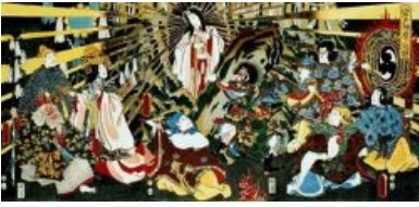
Аматэрасу собственной персоной

Составить точный пантеон богов синтоизма невозможно в принципе, но главной у них является ВНЕЗАПНО самка , по имени Аматэрасу (moon. ). Именно от неё и происходит род японских Ымператоров. Другие синтоистские боги «основали» японские острова. И вообще отношение к богам ( ками ) у синтоистов весьма своеобразное, ибо, согласно их взглядам, каждый человек после смерти станет ками . Раньше некоторые, в первую очередь