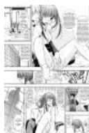
Глубокие переживания мико

С мико не всё так просто. Ходят неподтверждённые слухи, что в древности они использовали различные вещества , дабы поддерживать себя в состоянии транса. Впрочем, сим грешили представители почти всех религий. В отличие от каннуси, должность эта никогда не была наследственной, ибо мико запрещалось трахаться под страхом казни через заёб до смерти изгнания из б-гоугодной профессии жриц самой Аматэрасу и перевода в разряд обычных женщин. В наши дни большинство этих правил отошло на второй план, хотя незаужество мико всё равно остаётся обязательным требованием.