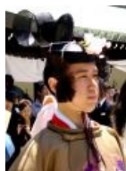
Подрастающее поколение каннуси