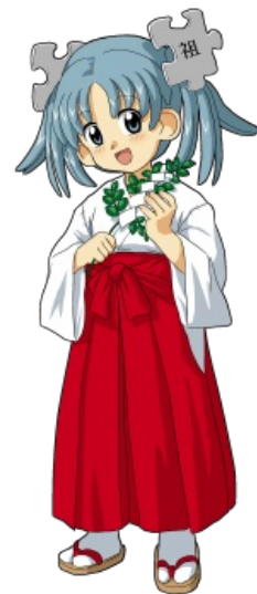
И даже педивикия