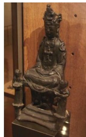
Дева Мария, таки да