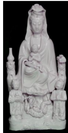
янона-мать Японская богоматерь

В силу своей лояльности и пофигизма синтоизм вполне спокойно относится ко всем прочим религиям Японии (хотя тех и менее доли процента каждой). Современный синтоист смело может отмечать все религиозные праздники, смешивая собственные, Рождество, а кое-где даже даже шажсей-важсей курбан-байрам, не являясь ни христианином ни, тем более, муслимом. Почему? Дык так веселее, да и от лишних праздников, даже не официальных, ещё никто не отказывался. Современный синтоист может быть даже