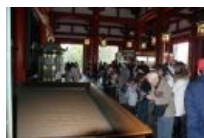
Идолопоклонники в синтоистском храме