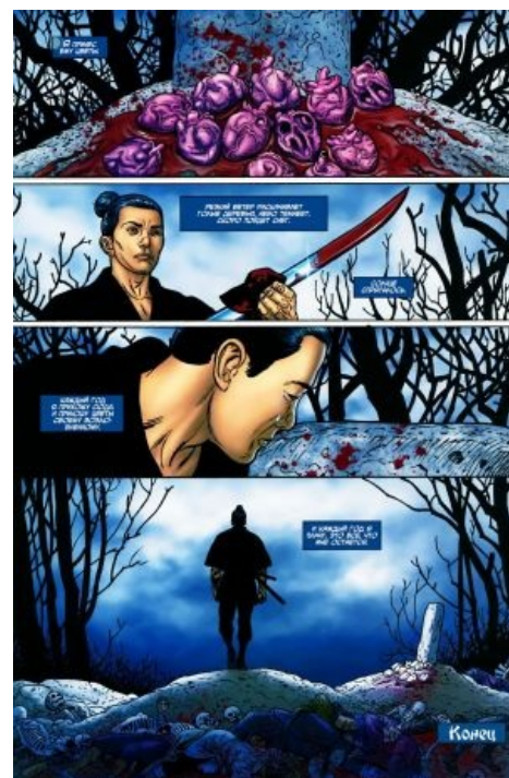
Самурай Ронин [1] справляет тризну