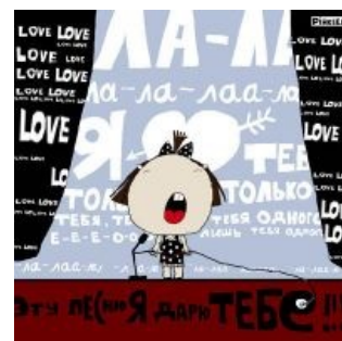
Источник головных болей

Вопросом ЗА ЧТО? «Отчего это возникает?» учёные занялись совсем недавно и пока далеко не продвинулись. Предположения хоть и возникают, но не очень убедительные. Так, профессор МакГилл считает, что связано это с историей эволюции человека. Тысячелетиями, даже после появления письменности, люди запоминали нужные им сведения, перекладывая их на музыку. Яркий пример — творения Гомера и ему подобных бродячих музыкантов. Сочетание ритма, рифмы и мелодии запоминается гораздо лучше, чем отдельные слова, вот и рефлекс, мол, такой занятный образовался. Не доказано, но довольно интересно.