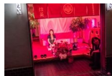
Типичный прилавок с поштучным товаром