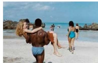
Где-то в Африке...

В дальнейшем секс-туризм приобрёл чёткое географическое разделение по половому признаку, а также стал источником лулзов для одних и стройматериалов для других.