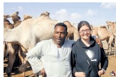
Стадо верблюдов — калым за белую женщину

У западных женщин в особом почёте Карибы, Ямайка, Барбадос, прибрежные страны Африки — в общем, достаточно нищие тропические страны, где местные мужики готовы ради пары баксов выебать хоть мамонта, плюс ко всему тамошние порядки к ебле ну никак не располагают. Обязательно нужно либо накопить денег, чтобы жениться, либо искать секс со шлюхой, причём нелегально. А денег — с гулькин хуй, секс со шлюхой в таких странах — далеко не комильфо, так что приходится довольствоваться тем, что есть.