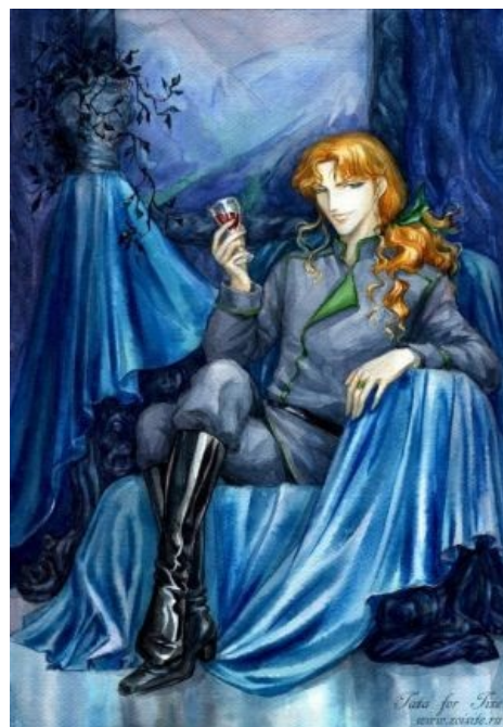
Яойный Зойсайт жоен

Особенно забавны «генералы» тёмной Королевы: Джедайт , Нефрит , Зойсайт и Кунсайт , чьи имена происходят от названия минералов, тонко намекая на умственные способности героев. «Камни» щеголяют в серых гимнастёрках, штанах-галифе и кирзачах. Прямо кровавая гебня из американских пропагандистских фильмов. Вот-вот вытащат маузеры , выведут в чисто поле, заведут за угол, поставят лицом к стенке и пустят пулю в лоб. Кстати, двое последних «генералов» проявляют ацки суровую мужскую дружбу , которая в последних сериях переходит чуть ли не в откровенную мужскую гомосексуальную однополую ёблю . Американцам такая «дружба» пришлось не по нраву и Зойсайт, путём женской озвучки и именованию «мадам» , был вынужден сменить пол. Мнение «мадам Зойсайт» до сих пор не выяснено. Наши же накосычили ещё эпичнее, сменив пол Харуке. Потом, правда, исправились и переводить стали правильно.