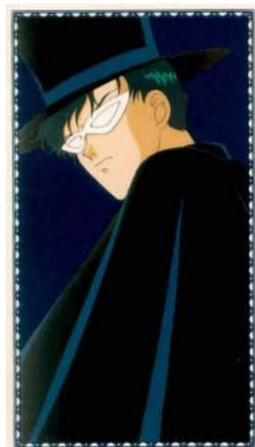
Я надеваю свой плащ и волшебную шляпу...

Из всех колдуний выделяется Сейлор Марс, применяющая реальную магию , которая называется Кудзи-