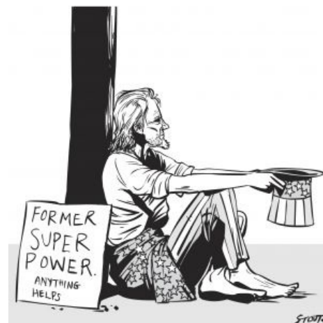
Дядя Сэм в чьих-то влажных мечтах

Безусловно признаётся сверхдержавой, как правило, лишь та страна, с мнением которой всегда вынуждена считаться любая другая. Определение тоже достаточно расплывчатое, но оно хоть позволяет отсекалть ёбаный стыд вроде «пивной сверхдержавы».