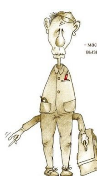
Сферический пациент в вакууме.

Повсеместная. Это нормальное состояние homo sapiens, по определению являющимся разумным, а вовсе не умелым. Общепринятая теория развития человека считает что homo sapiens (рукожоп) является прогрессом по сравнению с homo habilis (рукоплеч), и таким образом хитрожопость компенсирует рукожопость давая преимущество рукожопу