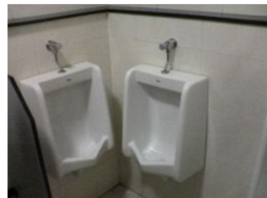
Пример работы пациента

Во втором случае — скорее наоборот, человек склонен подчеркивать свою техническую неумелость и бытовой идиотизм, при этом постоянно пытается на словах доказывать окружающим свою важность или занятость, не позволяющую «заниматься деталями», то есть работать. При попадании в руки хоть сколько-нибудь требующей практических действий проблемы, склонен скорее доломать и усугубить , чтобы после со спокойной рожей заявить, что теперь уж это точно не его дело, а специалистов. Агрессивно доказывает, что ему (ей) «это (знать) не нужно», и любит рассуждать в ключе «вы (все мне) должны».