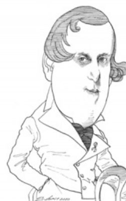
Карикатура на де Кюстина

Как-то раз нашли его около Парижа в луже, лежал он без сознания и побитый, кошелёк с документами пропал. Потом выяснилось, что он назначил свидание одному солдатику ночью, чтоб на голубую луну посмотреть вместе, а солдатик пришел не один, а с друзьями (возможно, это был акт борьбы с голубым нашествием, но не исключен и банальный гоп-стоп). Слух, конечно, распространился, и на обеды в гетеросексуальные графские семьи де Кюстина пускать перестали — тогда почти все светские хотели, чтобы вокруг думали, будто они не гомосеки. Но интеллектуальная элита Астольфа не отвергла. В-первых, среди интеллектуалов не считается зазорным трогать друг друга за попу или делать приятное по-другому. А во-вторых, есть мнение, что у интеллектуалов с баблом напряженка, де Кюстин же был богат.